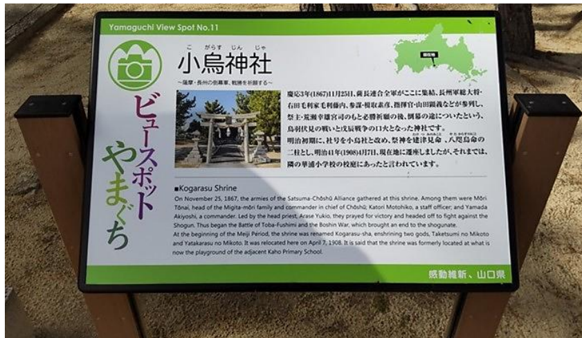
ビュースポット看板