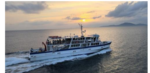
野島海運所有「レインボーのしま」を利用したクルーズ