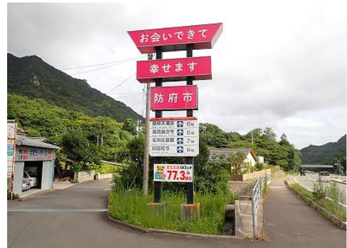
市境4か所に設置している歓迎塔