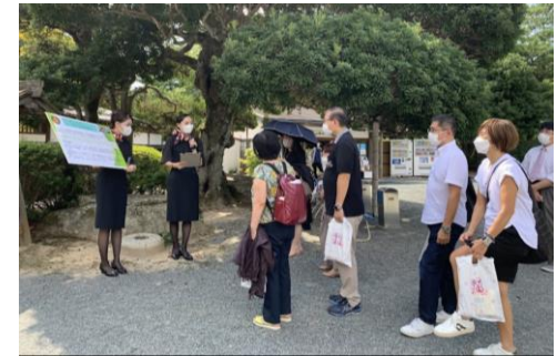
JALとの連携による首都圏発「防府満喫ツアー」

野島海運と連携し、昨年度初めて実施した同社所有船を活用した近海クルーズをさらに魅力的な内容に磨き上げて実施します。