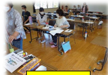
ストーンペイント