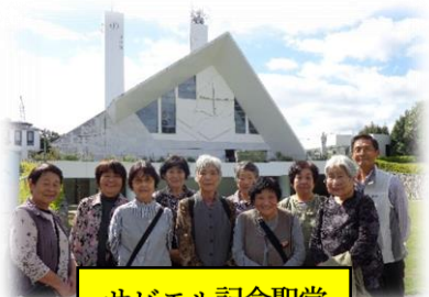
サビエル記念聖堂