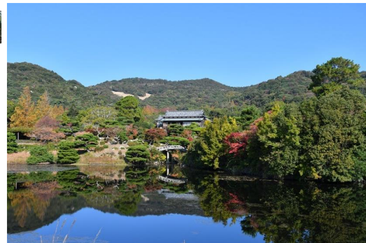
毛利氏庭園・毛利博物館