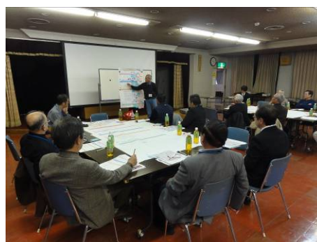
市民 WS の開催状況