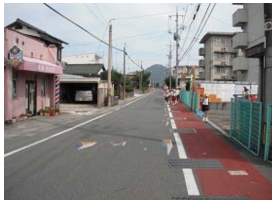
(通学路カラー舗装)