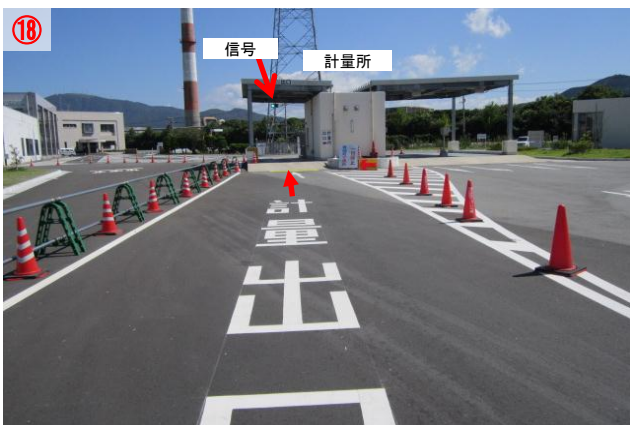
18 「計量所」の前まで行き一旦停止します 「信号」が「青」になったら「計量所」に入ります