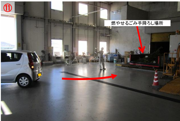
⑪ バックで駐車します