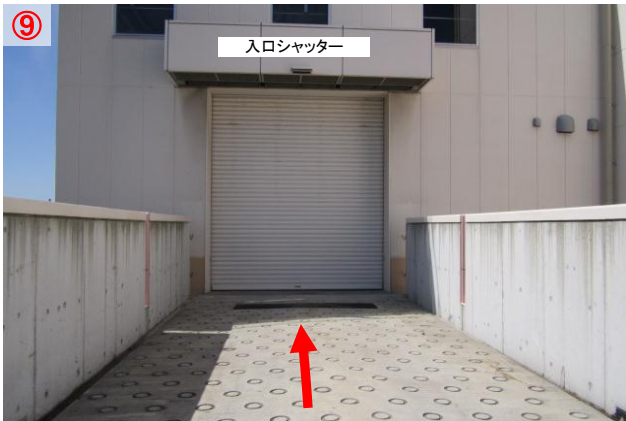
⑨ シャッターの前で一旦停止し、シャッターが全て開いたら中に入ります (シャッターは自動で開きます)