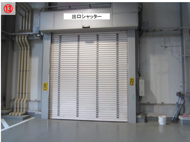
⑬ 燃やせるごみを降ろし終わると、車に乗り 出口シャッターの前で一旦停止し、シャッターが 全て開いたら外に出ます (シャッターは自動で開きます)