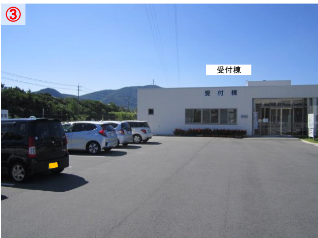
③ 駐車場に車を停めて「受付棟」に入ります