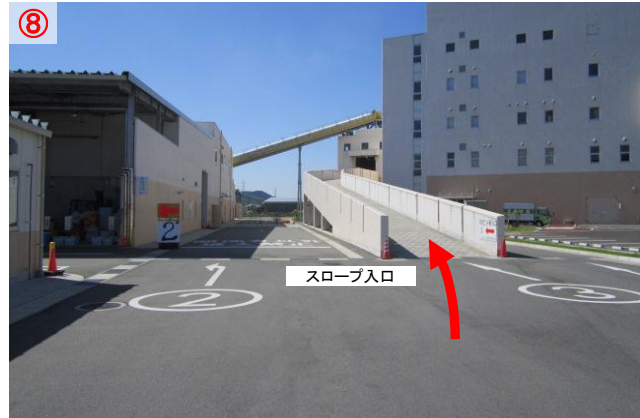
⑧ ③の表示を目印に、スロープを上がります