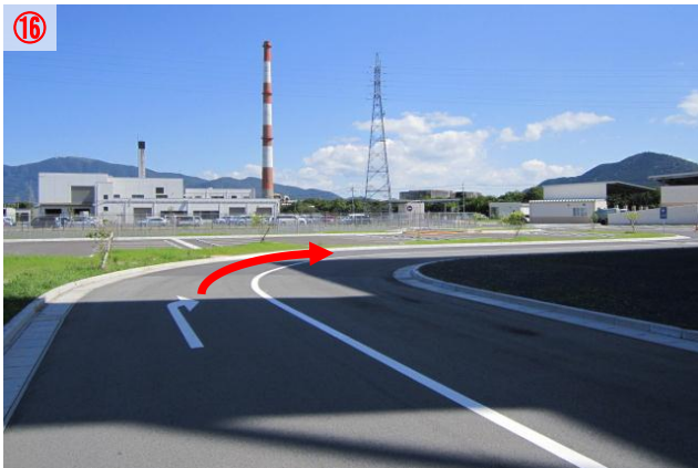
16 まっすぐ行き、道なりに右に曲がります