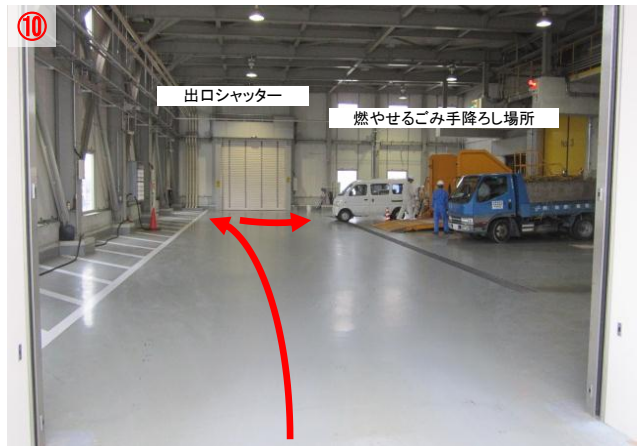
⑩ 「燃やせるごみ手降ろし場所」が一番奥です 係員の指示に従いバックで駐車します