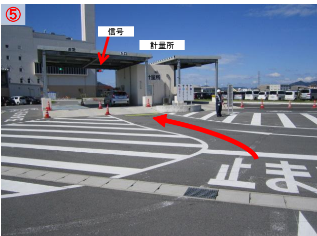
⑤ 車に戻り、「計量所」の前まで行き一旦停止します 「信号」が「青」になったら「計量所」に入ります