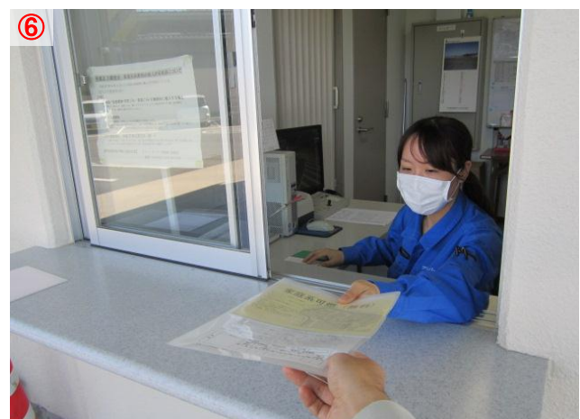
⑥ 受付時に貰った「搬入ファイル」を係員に渡します 「搬入ファイル」はすぐに戻されるので、車のダッシュボードの上に置きます