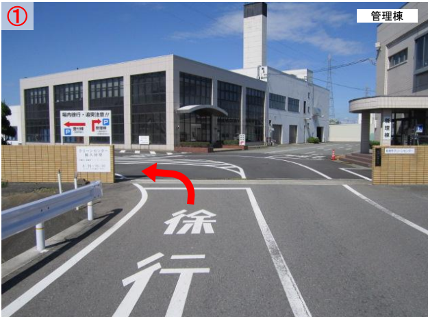
① クリーンセンターへ入ったらすぐ左に曲がります