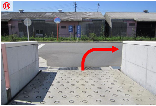
14 スロープを下って、突き当たりを右に曲がります