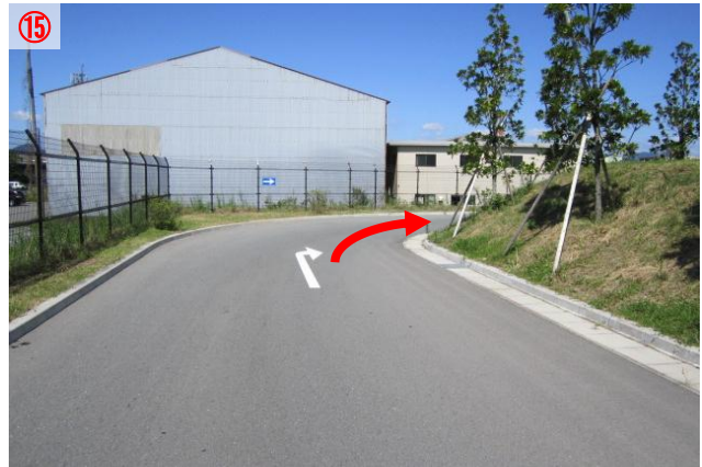
15 まっすぐ行き、道なりに右に曲がります