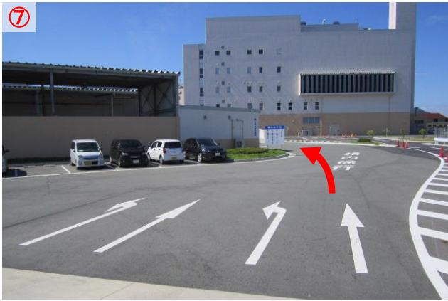
⑦ 計量所から出たらまっすぐ道なりに進みます (地面や看板に③と表記してある方向へ進みます)