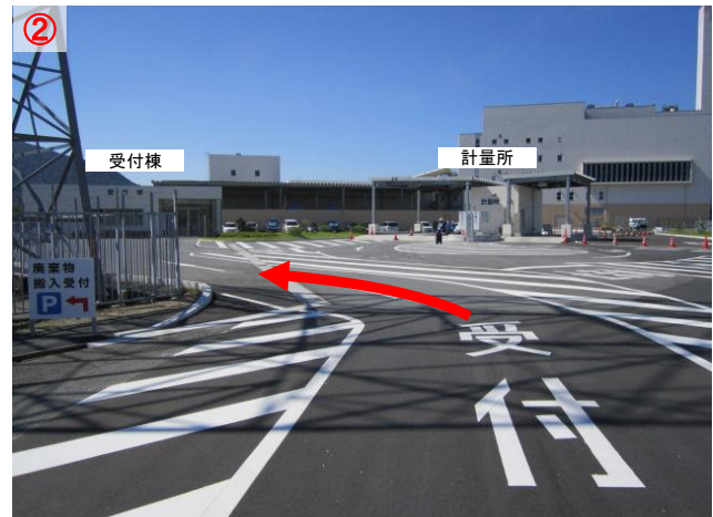
② しばらくまっすぐ行き、「受付」の案内に従い左に曲がります