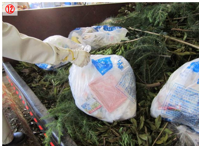
⑫ ボックスの中に燃やせるごみを入れます