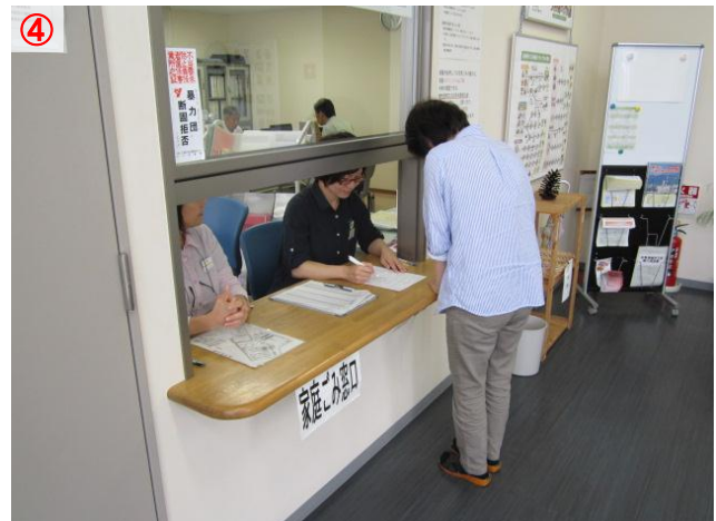
④ 申請書に必要事項を記入し「運転免許証、健康保険証」等の本人確認が出来るものと一緒に係員に提示します 係員確認後、「搬入ファイル」を受け取ります