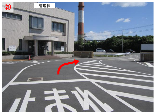
21 「管理棟」の前で右に曲がり外へ出ます