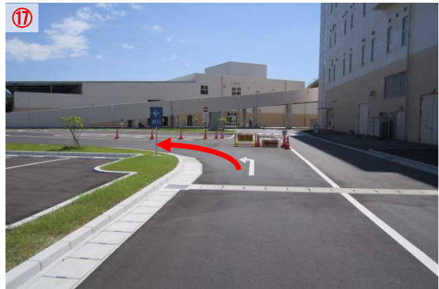
17 「出口←」看板を目印に左に曲がります