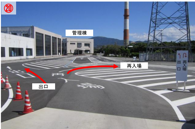
20 不燃ごみ、資源ごみ等がまだある場合は「再入場」方向へ進み、再度「計量所」へ入ります ごみがもう無い場合は「出口」方向へ進みます