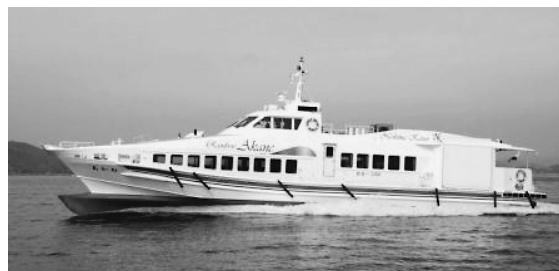
離島航路（定期船「レインボーあかね」）

※バリアフリー 子どもから高齢者や障害者など、あらゆる人々が、社会生活に参加し行動するうえで、妨げとなっている様々な障壁（バリア）を取り除くこと。