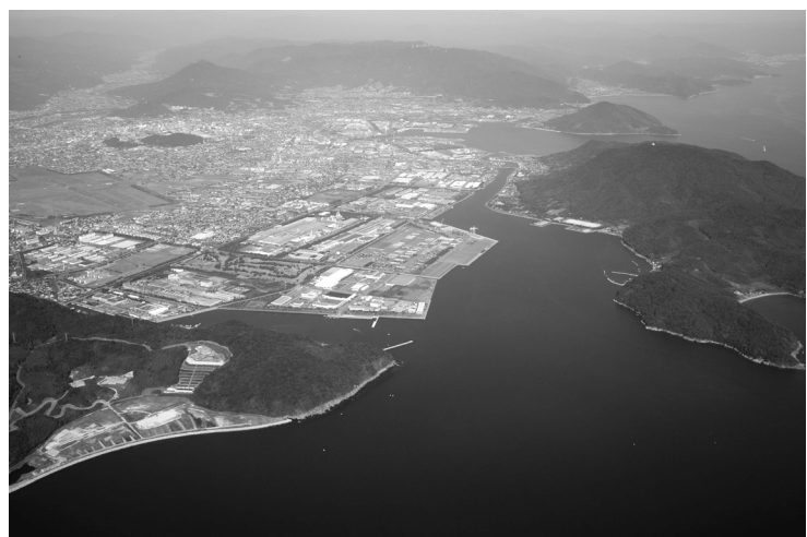
重要港湾三田尻中関港

<主な取組>◆港湾施設の整備促進 ◆港湾施設の利用促進 ◆「 ※ みなとオアシス三田尻」の活用