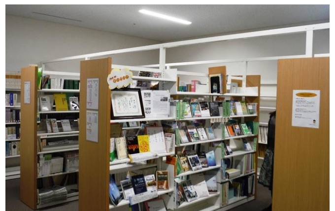
議会図書室 兼 市政資料室