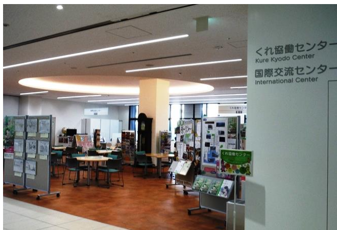
1F 協働センター (災害時はボランティアセンターに)