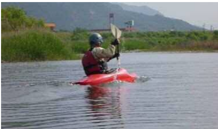
写真-2 佐波川カヌー練習風景