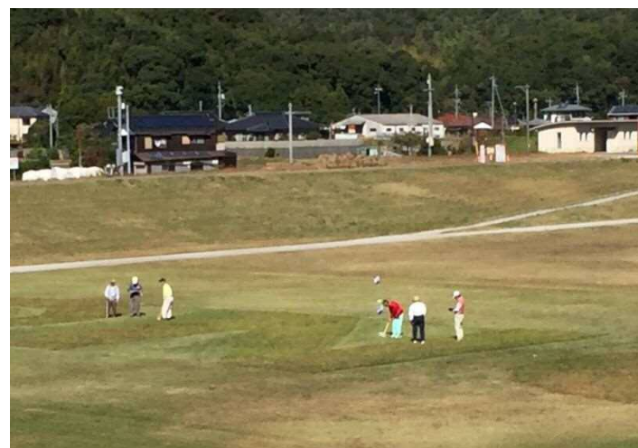
写真-4 グラウンドゴルフ練習風景（小野地区）