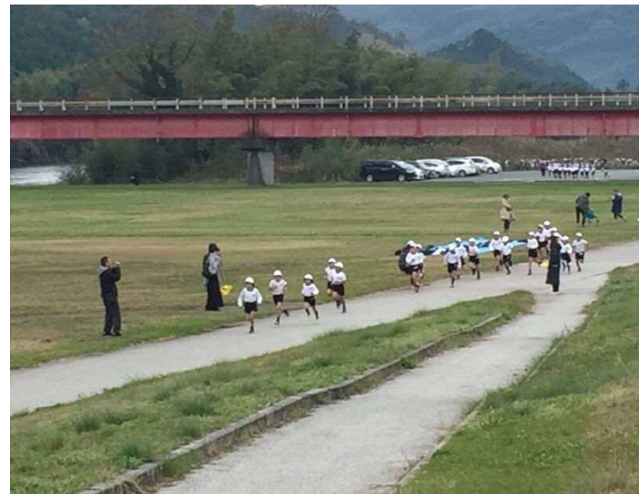
写真-3 マラソン大会風景（小野地区）