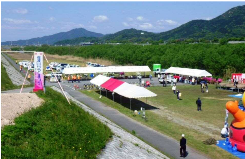
写真-1 華城つつじまつり風景（平成28年）