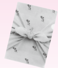
C 幸せますクリアファイル 15名様