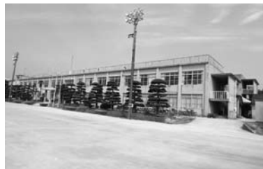
解体予定の桑山中校舎

市長 市民満足度の高い施策を推進していくための組織の構築は当然であり、政策立案及び財政を担当する部署を統合した部署の新設や、最終意思決定機関として、全庁横断的な立場で審議を行う(仮称)経営会議の新設も必要なことと考えている。