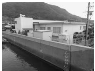
高潮対策が望まれる向島公民館

市長 平成11～14年度に離岸堤整備、平成16～18年度に鋼管防波堤整備、平成24年度は郷ヶ崎東区の一部で護岸の高上げ、消波ブロック設置などを行った。今後も施設改良や老朽化対策など海岸保全に努める。