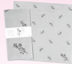
B 幸せます風呂敷 7名様