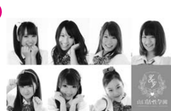
ご当地アイドル山口活性学園