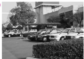
既存のタクシー車両を使用

先に特別委員会で視察した静岡県富士宮市では、市内のタクシー事業者(複数)に委託してデマンドタクシーを運行しており、大きな実績をあげている。その主な内容は①既存のタクシー車両を使用する(デマンド業務以外は通常のタクシーとして使用する)、②交通空白地域と中心市街地のみを運行する③料金はバス並みとする、④運行はドア・ツー・ドアのサービスにする、⑤利用者は会員登録をし、一時間前予約とする、⑥各エリアの運行経費を定め、乗車賃で賄えない金額を委託料として市が支払うというものだが、参考にすべきではないか。