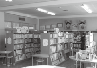
学校司書の配置が望まれる学校図書館

問 まちの駅「うめであす」が平成22年4月に開設され、4月で4年目となります。この施設を拠点に既存の施設、店舗等と「まちの駅ネットワーク」をつくり、おもてなしの向上を図るとしていましたが、進んでいない。今後どうするのか。