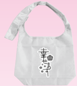
A 幸せますバッグ 5名様