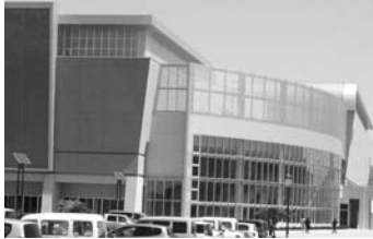
行政改革の裏で、新体育館では官製ワーキングプアが…。

働くなら防府（松浦市長）— 言えますか？ 養護新体育館は47人が非正規社員、正社員4人