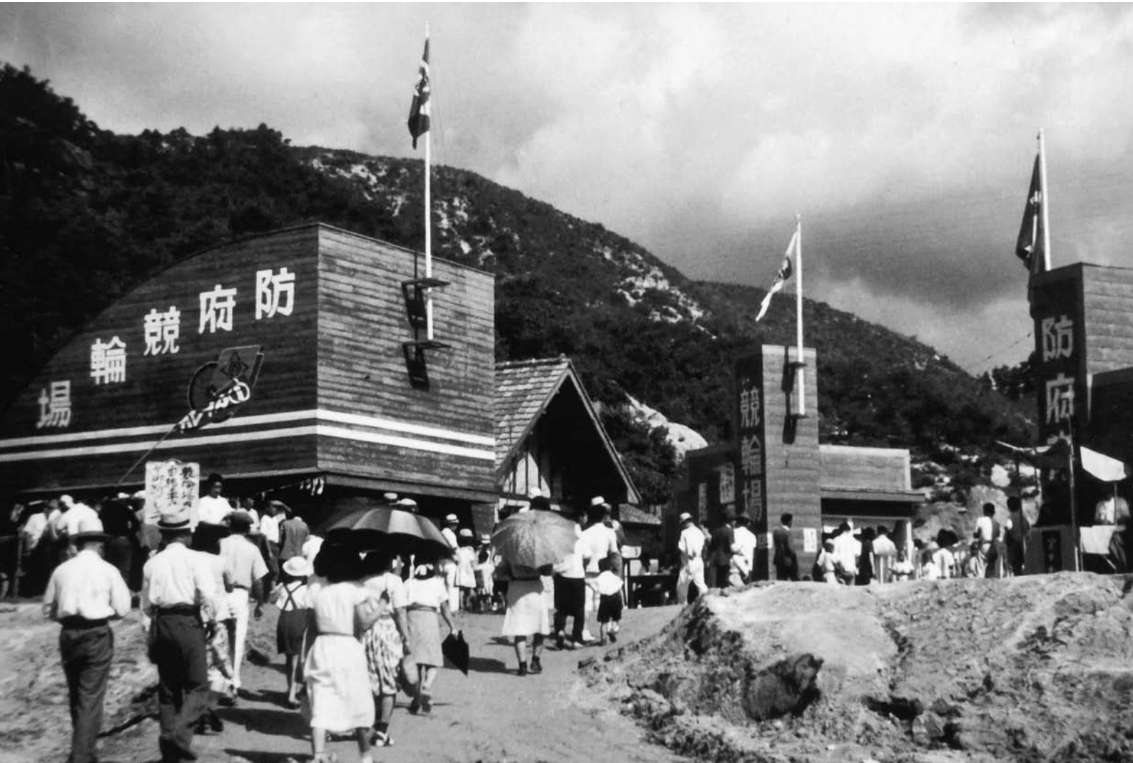
昭和25年開設当初の防府競輪場