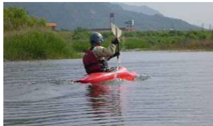
佐波川カヌー練習風景