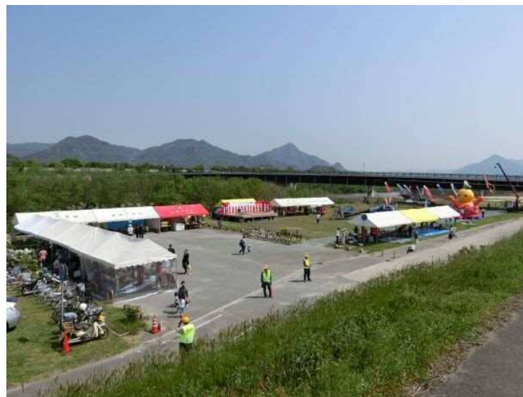
写真-1 第22回 佐波川つつじまつり風景 (平成29年4月30日)