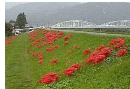
彼岸花のイメージ