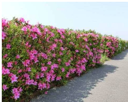
左岸側つつじの状況 (平成29年4月30日)