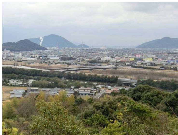
写真-2 二六台からの眺望 (佐波川、大崎橋を望む)