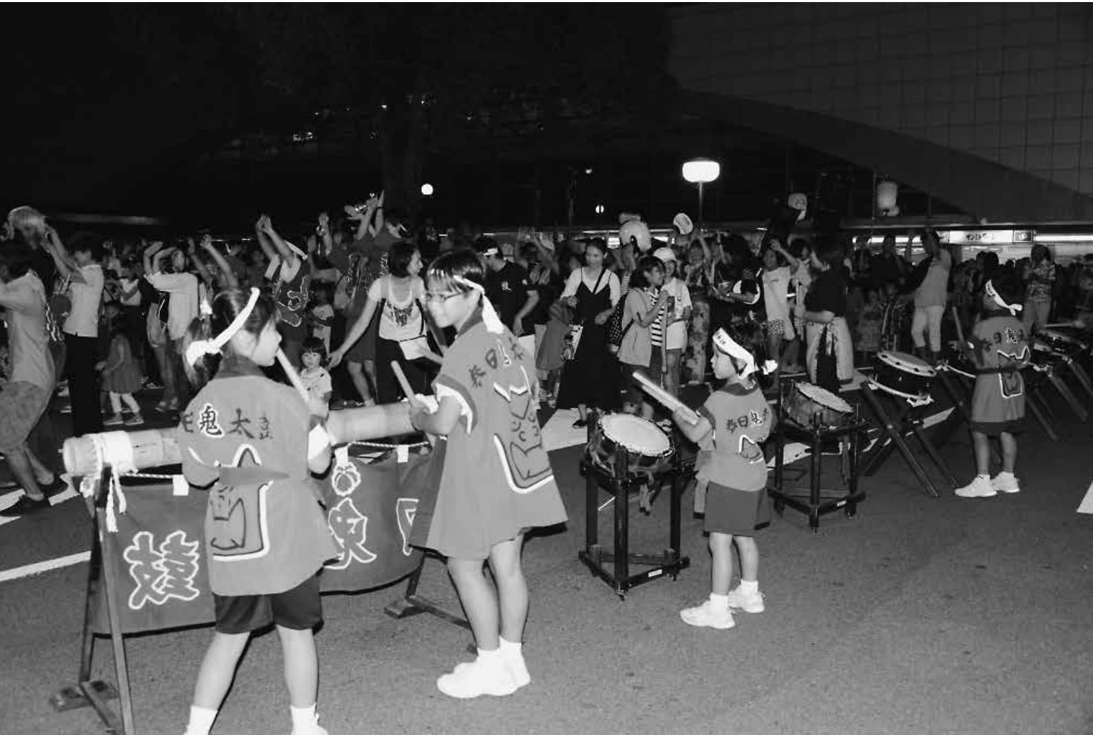
熱気あふれる防府おどりの様子