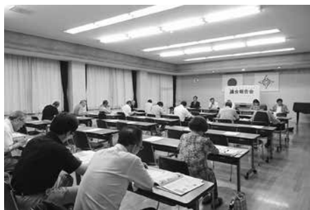
各地区の報告会の様子