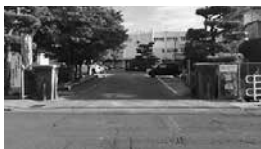
安全対策が必要な華城小学校前

問 市内最大の小・中学校の通学路で、特に安全対策が必要なものとして、安全対策が必要な華城小学校前小学校