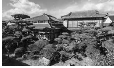
白石家住宅主屋外観

今回の登録に伴い、山口県の登録有形文化財は、101件となり、うち防府市内では13件となりました。