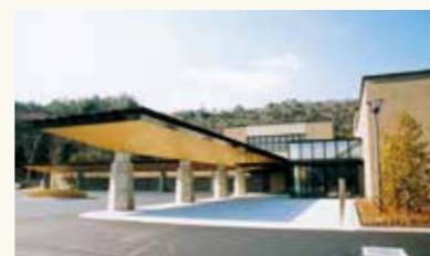
防府市斎場「悠久苑」オープン(平成15年4月)