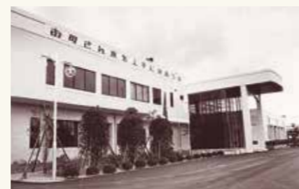
水道局新庁舎完成(昭和55年4月)