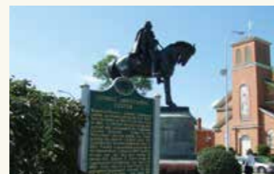
米国ミシガン州モンロー市と姉妹都市提携(平成5年5月)