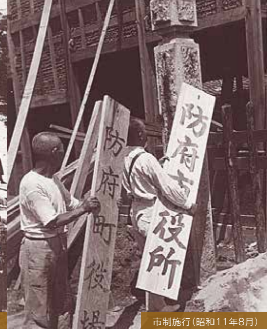
市制施行(昭和11年8月)