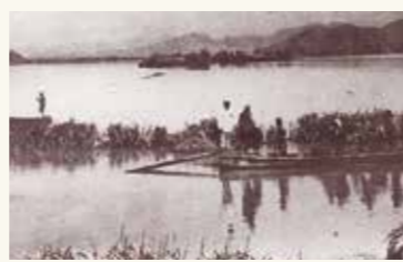
佐波川大洪水(大正7年)