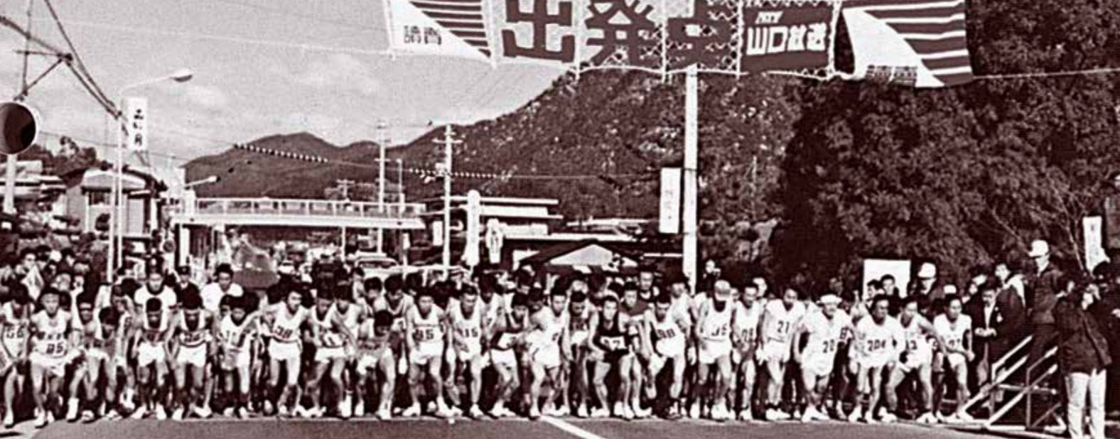
第1回防府読売マラソン大会開催(昭和45年12月)