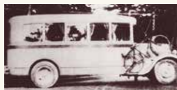
国鉄バス営業開始(昭和6年)