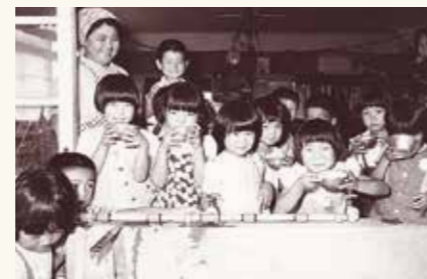
野島簡易水道完成(昭和49年9月)