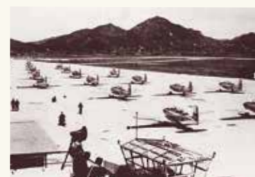
航空自衛隊防府基地設置(昭和29年12月)