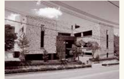
新図書館オープン(昭和56年7月)