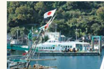
「レインボーあかね」就航(平成24年11月)