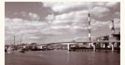
三田尻大橋完成(昭和62年3月)