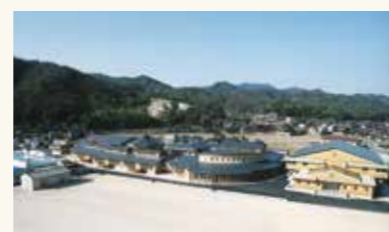
小野小学校新校舎完成(平成16年4月)