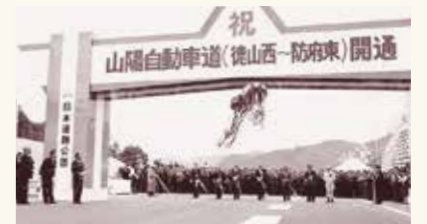
山陽自動車道開通(昭和61年3月)