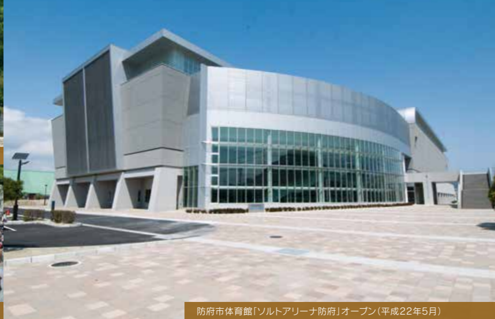
防府市体育館「ソルトアリーナ防府」オープン(平成22年5月)