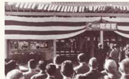
三田尻駅を防府駅に改称(昭和37年11月)