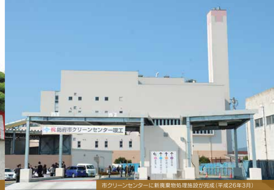
市クリーンセンターに新廃棄物処理施設が完成(平成26年3月)