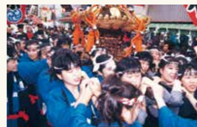
天神祭に「天神おんな神輿」が登場(昭和63年12月)