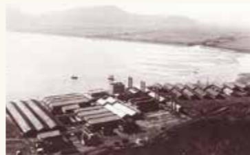
向島製塩工場設置(大正7年)