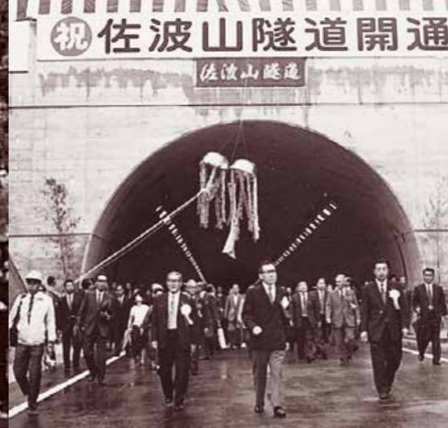
佐波山トンネル開通(昭和48年9月)