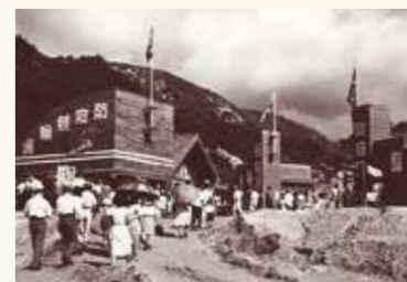
防府競輪場開設(昭和24年9月)