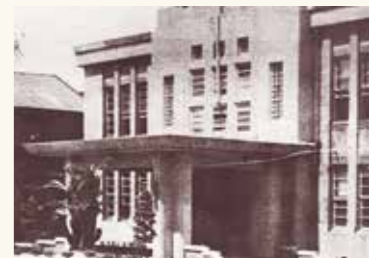
市議会議事堂完成(昭和15年2月)