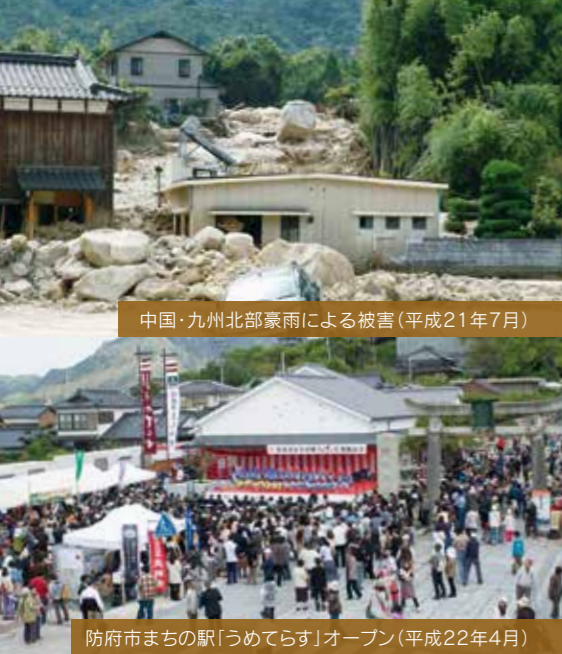
中国・九州北部豪雨による被害(平成21年7月)