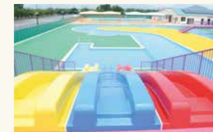
スポーツセンタープールオープン(平成26年7月)