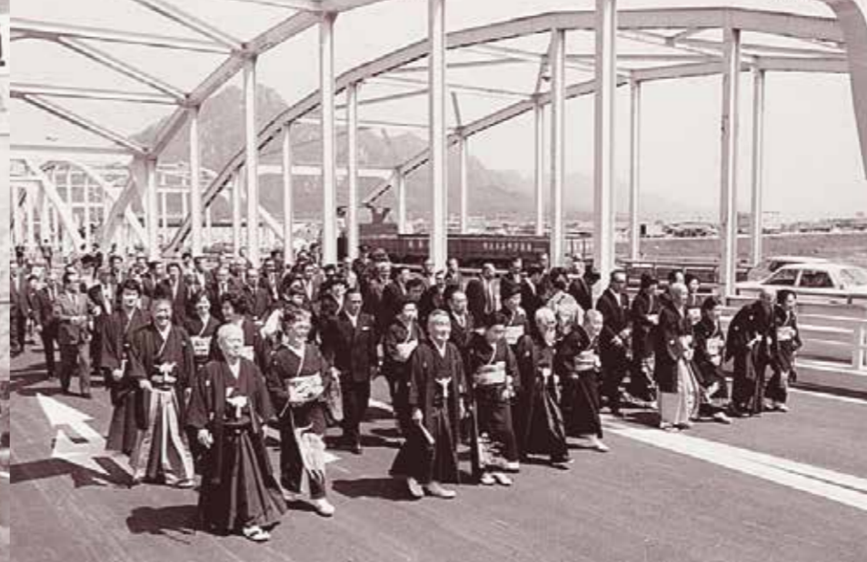
新「新橋」開通(昭和53年4月)