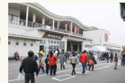
潮彩市場防府が「道の駅」として開業(平成27年10月)