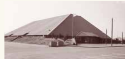
防府スポーツセンター体育館完成(昭和49年3月)