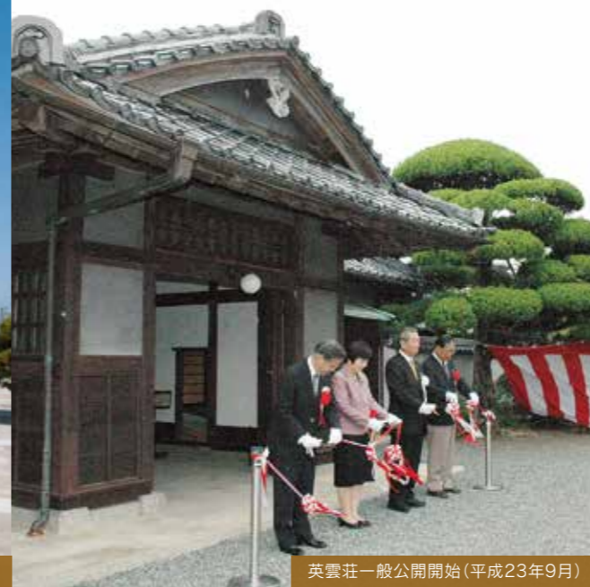
英雲荘一般公開開始(平成23年9月)