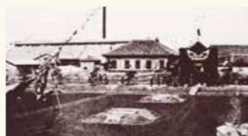
日本専売公社防府製塩試験場設置(明治42年)