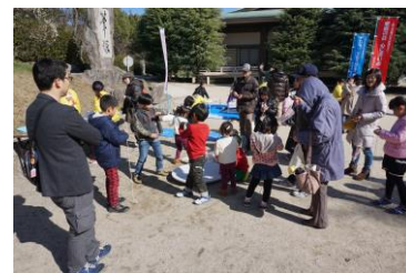
▲ 防府天満宮での様子