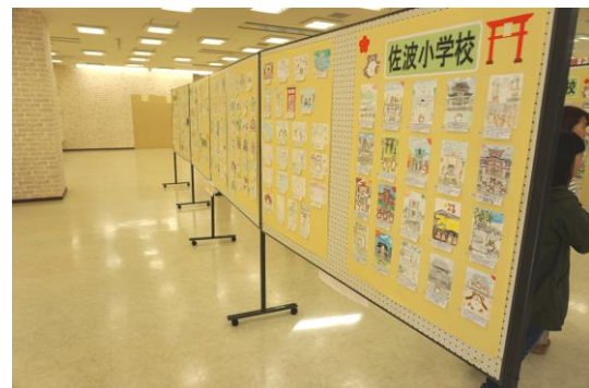
▲ ルルサス防府1階において、応募いただいた全作品を展示しました ▲