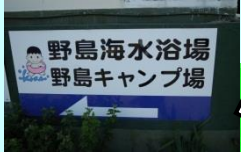
看板の⇒の方向に進む