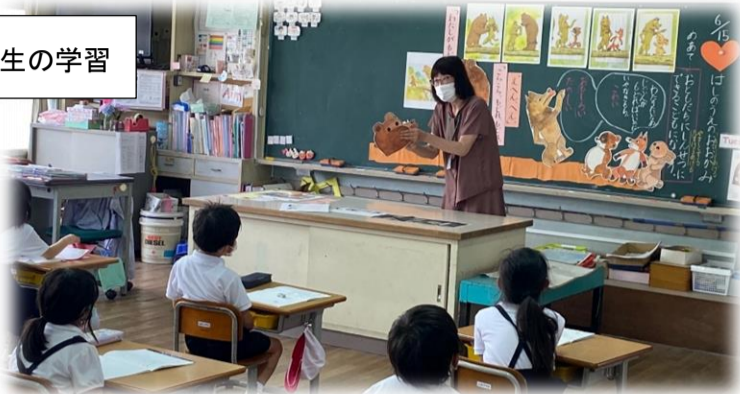
小学校1年生の学習