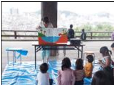
「家庭の日」親子ふれあいイベント