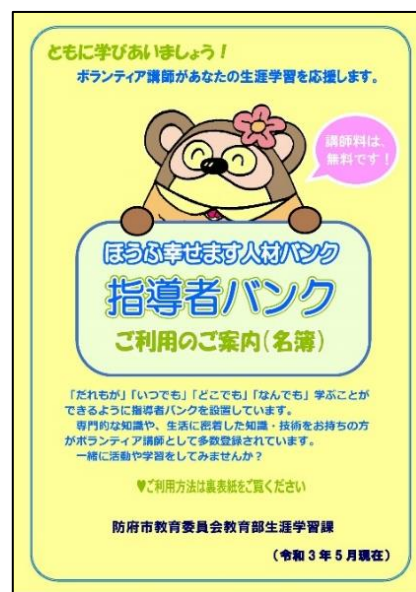
『ほうふ幸せます人材バンク「指導者バンク」』のメニュー表（表紙）