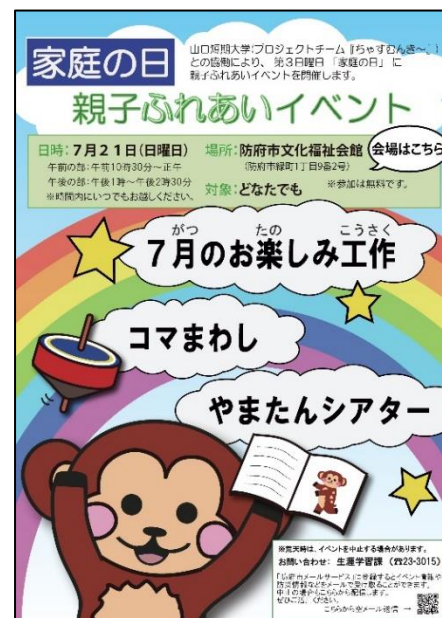
「家庭の日」親子ふれあいイベントのポスター

家庭教育アドバイザー：山口県が開催している家庭教育アドバイザー養成講座を修了し、子育ての悩みの相談や子育て情報の提供等の家庭教育支援に携わる人。