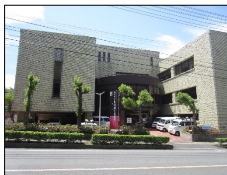
文化財郷土資料館