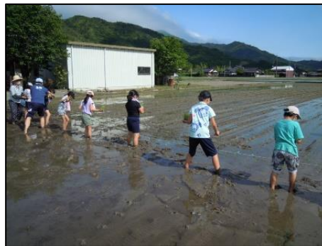
放課後子ども教室