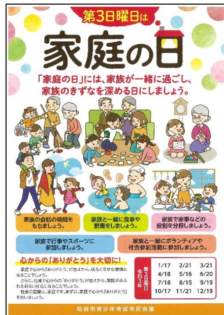
「家庭の日」運動の啓発チラシ