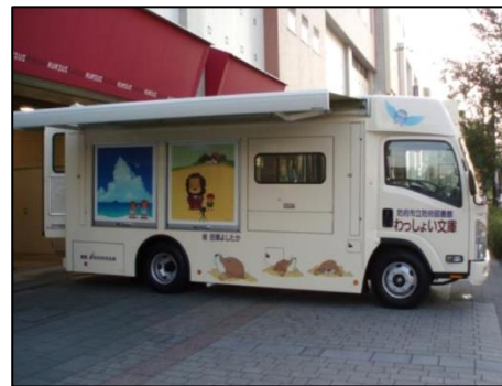
移動図書館車（わっしょい文庫）

移動図書館車 ：図書館を直接利用しにくい利用者のため、資料を積んで定められた場所（ステーション）に行き、貸出し・返却業務等を行うための車両。