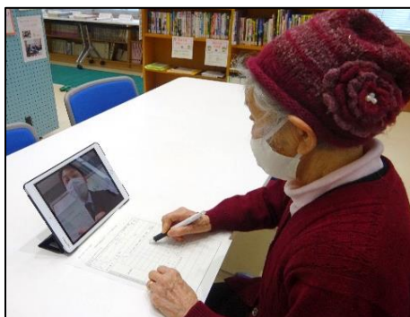
タブレット端末の活用