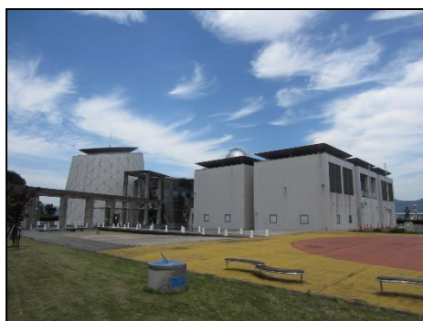
青少年科学館（ソラール）