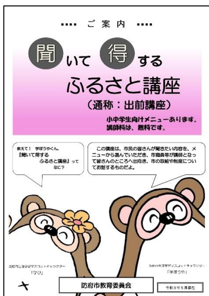
「聞いて得するふるさと講座」のメニュー表（表紙）