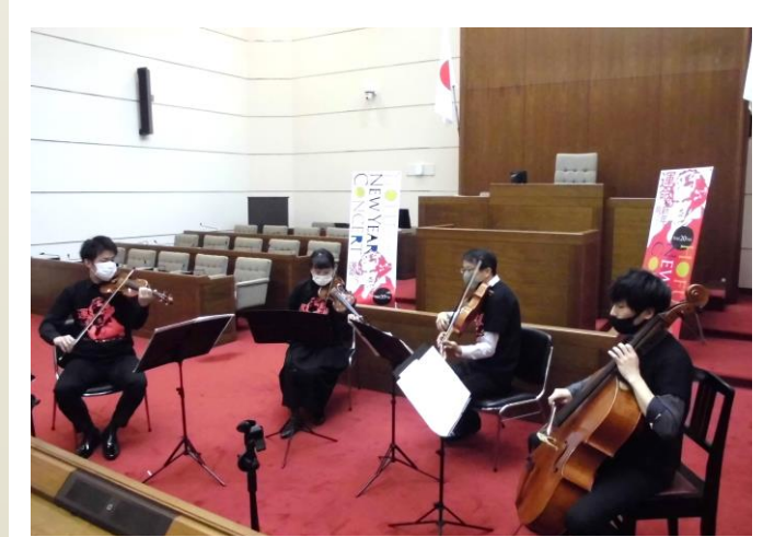
議場コンサート（無観客演奏での録画配信）

※新型コロナウイルス感染症の感染拡大防止のため、今年度は議会報告会を中止しました。