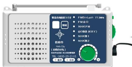
緊急告知防災ラジオ