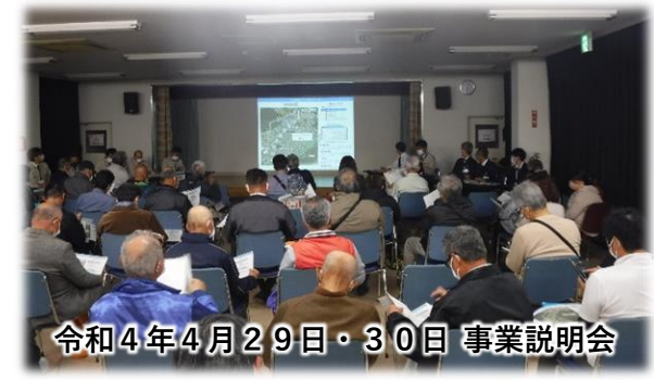
令和4年4月29日・30日 事業説明会