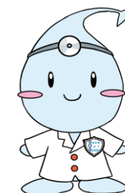
日本水道協会 マスコットキャラクター 「Dr.すいどー」