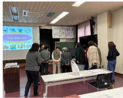
(女性向け防災セミナー)