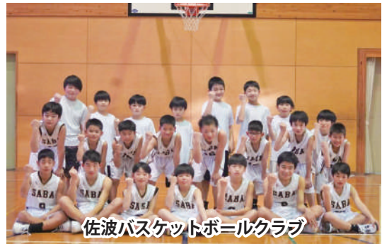
佐波バスケットボールクラブ