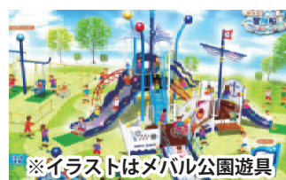
※イラストはメバル公園遊具

注目情報 ほうふし ニュース イベント スポーツ 文化 子育て・健康 安全・安心 お知らせ 叙公 勲表 赤ちゃん 写真掲載 カレンダー