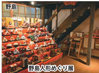
野島人形めぐり展