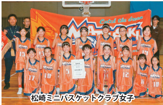
松崎ミニバスケットクラブ女子