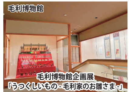
毛利博物館企画展 「うつくしいもの-毛利家のお雛さま-」