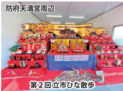
第2回立市ひな散歩