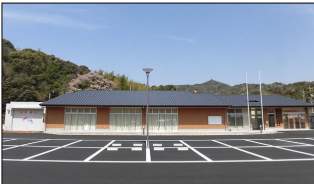
小野公民館（老人憩の家、分団消防器庫を複合化）