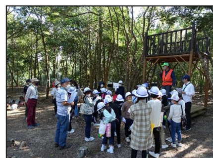
華浦地区（森林公園での野外遊び）