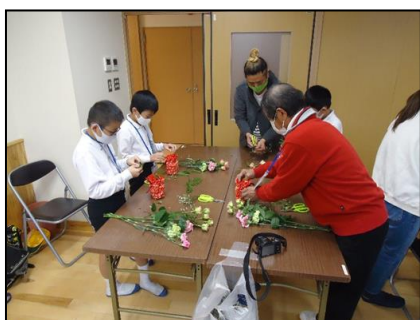
勝間地区（フラワーアレンジメント）