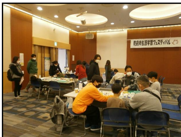
▲ものづくり講座 (防府市子ども会育成連絡協議会)