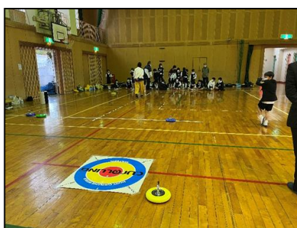
西浦地区（カラーリング）