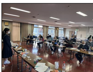
第2回（科学実験・科学工作）