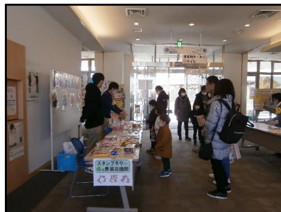
▲スタンプラリー（ルルサス防府2階ロビー）