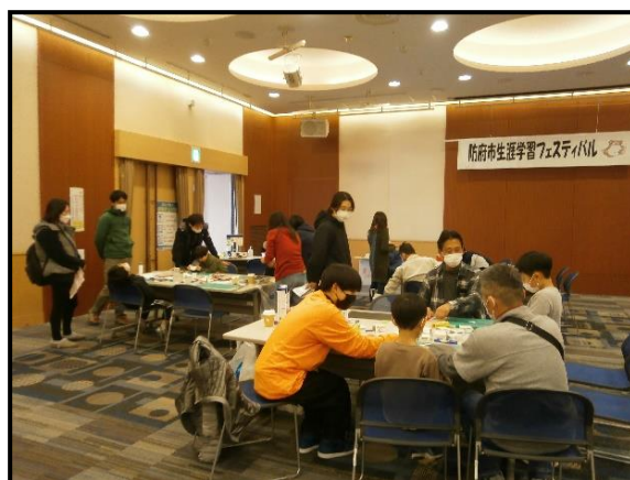
▲ものづくり講座 (防府市子ども会育成連絡協議会)