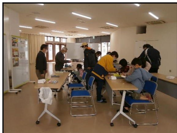
▲紙筒ロケット作り（文化センター交流室4）

ルルサス文化センターを中心に図書館やアスピラート等の笑顔満開通り一帯の施設と連携・協働し、ルルサス防府・アスピラートでは4年ぶり、ルルサス文化センターでは初めての開催となった。大会テーマを会場の笑顔満開通りにちなんで「学びあふれて笑顔満開」とし、28の個人・団体による講座やものづくり等の企画を実施した。天候にも恵まれ、5年ぶりにわっしょい広場で発表会・セレモニーを実施し、セレモニーでは過去最多の11の個人・団体がまちの達人表彰を受賞した。また、実行委員会主催のアトラクションとして4年ぶりにスタンプラリーを実施した。