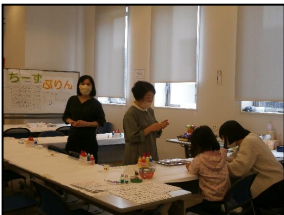
▲ものづくり講座（ちーずぷりんぐ）