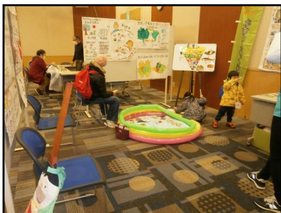
▲食育講座 (食べよう!!育もう!!かむカム♡くらぶ)