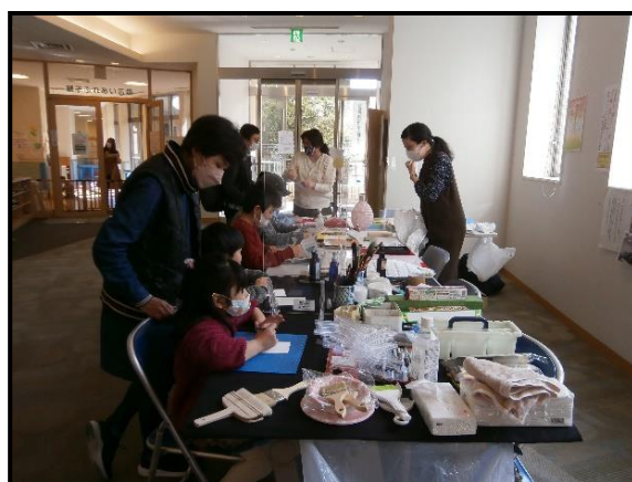
▲体験講座 (古文書を読む会)