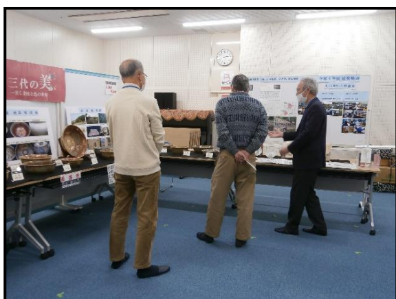
▲作品展示 (西浦焼愛好会)