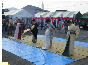
開会式、子ども会、フォークダンス同好会、前結び着付け教室