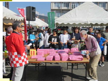
合唱組曲「佐波川」を歌う会、佐波幼稚園、3B体操、お楽しみ抽選会