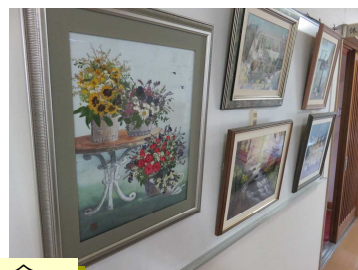
絵手紙同好会、パッチワークサークル、食生活改善推進協議会、すずらん会

【PR】佐波中学校区地域協育ネット =笑顔がつなく「みちざねっと」= めざす子どもの姿：ふるさとを愛し、ふるさとから愛される、心豊かな子ども