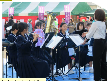
あいさつ標語表彰式、さざなみキッズサイクリーズ、佐波中学生徒有志「よさこい」、佐波中吹奏楽部