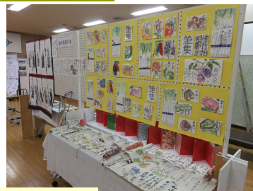
華道家元池坊、こどもいけばな教室、楽しい手ぬい・カントリードール、絵手紙用の会