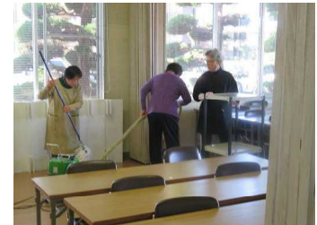
館内外すべてきれいに 年末大掃除