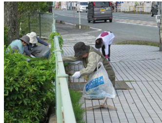
女性部の皆様による作業