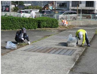
高倉健寿会の皆様による作業

また、12月には平素から公民館を利用される講座・サークルや学級・教室などの代表の方にお集まりいただき、館内外の大掃除を行いました。30名以上の方が取り組んでくださり、きれいに整った公民館で新年を迎えることができました。誠にありがとうございました。今後ともご支援とご協力のほどよろしくお願いいたします。