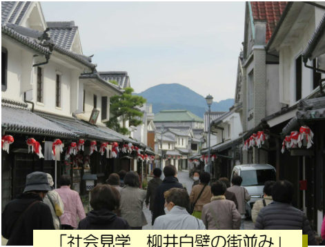
「社会見学 柳井白壁の街並み」