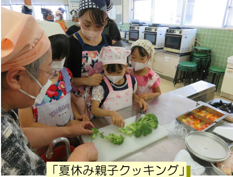
「夏休み親子クッキング」