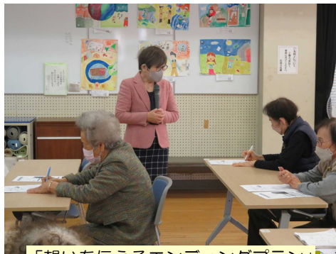
「想いを伝えるエンディングプラン」

高齢者が求める現代社会の課題を中心に、文化、歴史、教養、健康など、様々な分野の学習に取り組みます。月に一度「よりよい生きがいづくり」につながる学習に参加されてみてはいかがでしょうか。