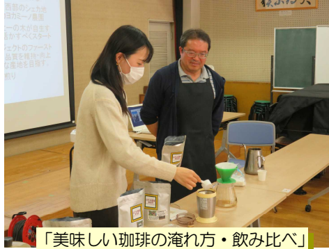
「美味しい珈琲の淹れ方・飲み比べ」

調理活動も再開できました。親子で楽しい時間を過ごしました。趣味や健康、教養など多岐にわたり、生活の質を高めるのに役立つ講座ばかりです。また、子育ての情報交換の場としても役立っています。