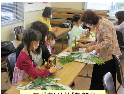
こどもいけばな教室