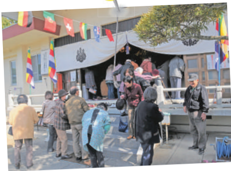
岩淵山観音寺 冬の縁日