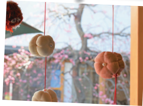
梅まつり 18日(日)～3月3日(日)