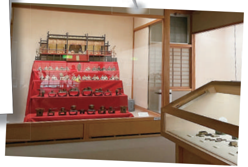
毛利家の雛まつり