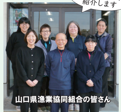
山口県漁業協同組合の皆さん