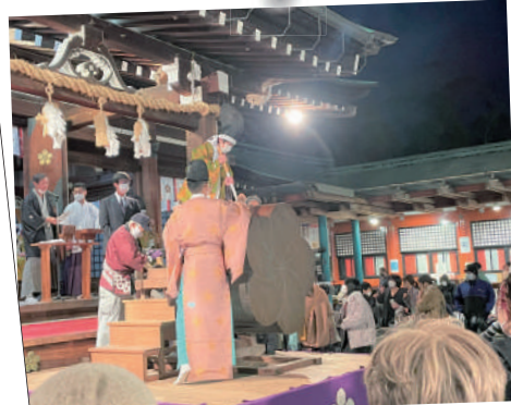
牛替神事 2日(金)～3日(土) 防府天満宮