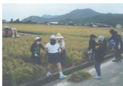
小学生の田植体験