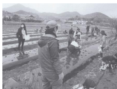
田植え体験の協力支援