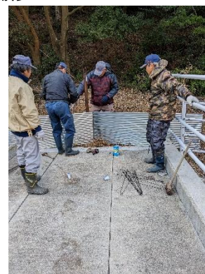
鳥獣害防護の設置