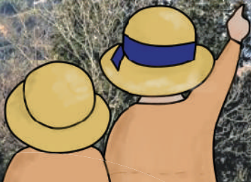
大平山山頂公園からの景色