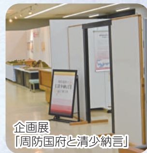
企画展「周防国府と清少納言」

現在、英雲荘では防府商工高校3年生が制作した平安装束の着付け体験をお楽しみいただけます。また、文化財郷土資料館では企画展「周防国府と清少納言」を開催中です。この機会に市内に残るゆかりの地巡りや体験を通じて、平安貴族の気分を味わってみませんか。