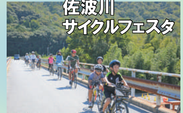
佐波川 サイクルフェスタ

いますぐ、みんなでチャレンジできるカーボンニュートラルの取組みを普及啓発しました