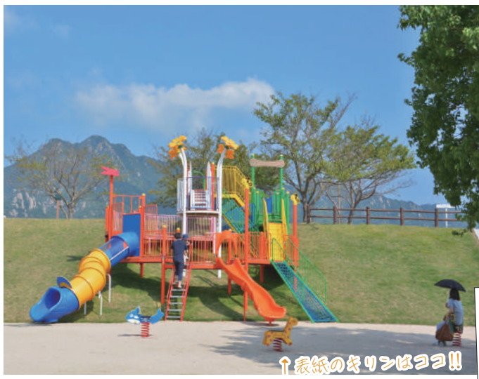
↑表紙のキリンはつづ!!

周辺に広がる緑地が、この場所の魅力をさらに高め、斜面での芝すべりや、ウォーキング、ランニングを楽しむ姿も。春は桜や芝桜が咲き誇り、いつでも子どもたちの笑顔があふれています。