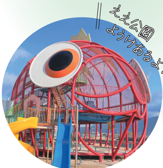
がんばるメパル号