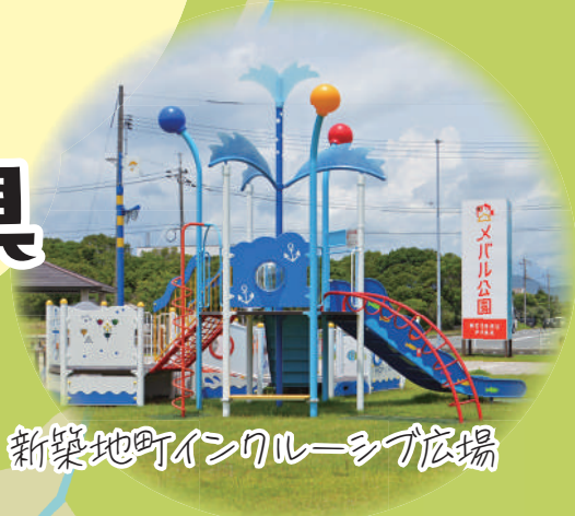
新築地町インクルーシブ広場