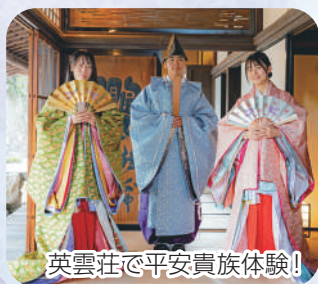
英雲荘で平安貴族体験!

現在、英雲荘では防府商工高校3年生が制作した平安装束の着付け体験をお楽しみいただけます。また、文化財郷土資料館では企画展「周防国府と清少納言」を開催中です。この機会に市内に残るゆかりの地巡りや体験を通じて、平安貴族の気分を味わってみませんか。