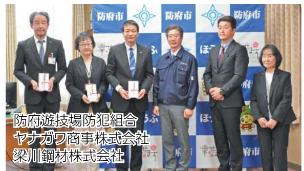
防府遊技場防犯組合 ヤナガワ商事株式会社 梁川鋼材株式会社