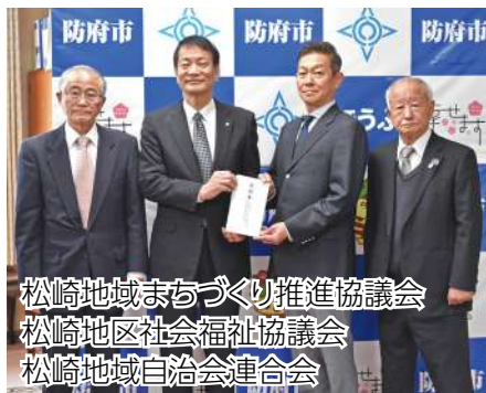
松崎地域まちづくり推進協議会 松崎地区社会福祉協議会 松崎地域自治会連合会