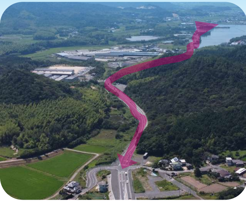
台道・鑄銭司拡幅