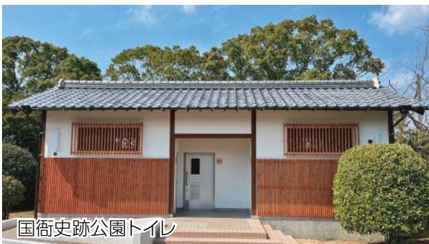
国衙史跡公園トイレ