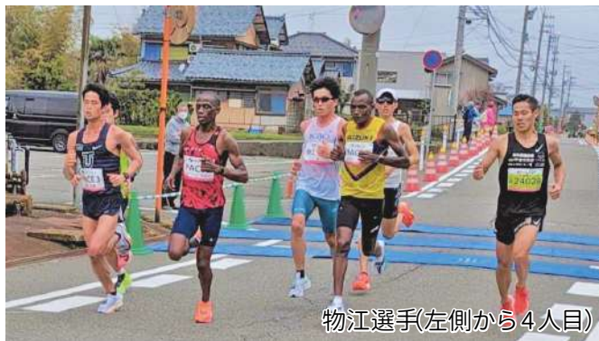
物江選手(左側から4人目)