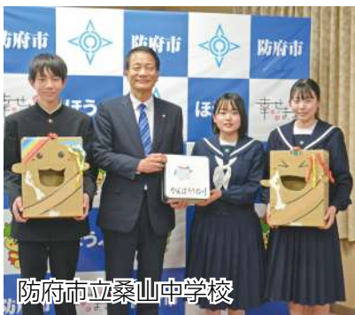
防府市立桑山中学校