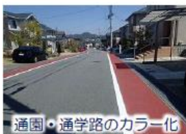
通園・通学路のカラー化