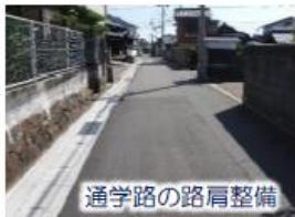
通学路の路肩整備