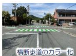
横断歩道のカラー化