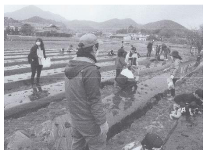
田植え体験の協力支援