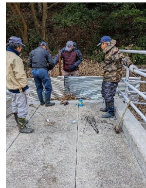
鳥獣害防護の設置