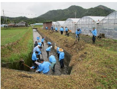
水路の草取り、泥上げ