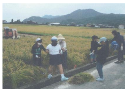
小学生の田植体験