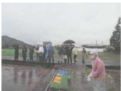
お田植祭の協力支援