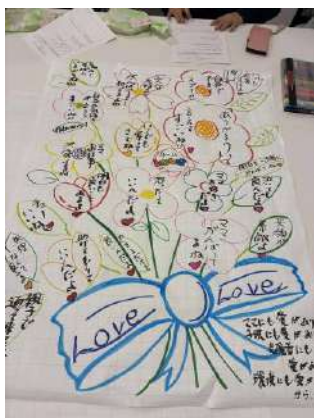
◀やさしい言葉で彩られた 大きな言葉の花束