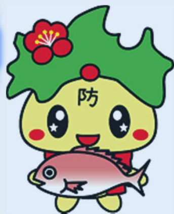
防府観光マスコットキャラクター 「ぶっちゃん」