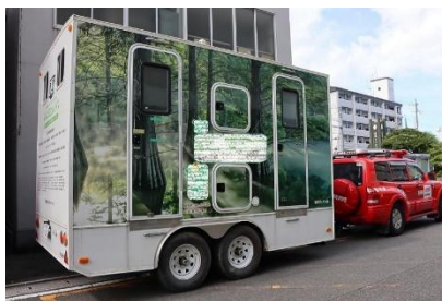
(トイレトレーラー)