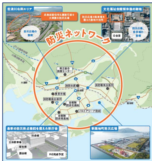
(第5次防府市総合計画重点プロジェクト)

能登半島地震を踏まえた避難所環境の改善を図るため、トイレトレーラーや段ボールベッド、パーティションのほか、アレルギー対応食など要配慮者支援物資を確保するとともに、幹線道路ネットワーク沿いにある防府市スポーツセンター等の防災拠点に大型防災倉庫を整備します。