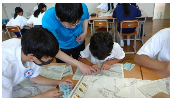
学校と地域が連携した防災教育