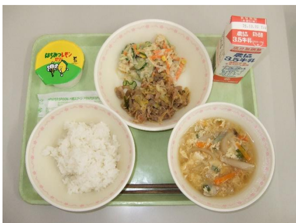
給食（デザートの日）