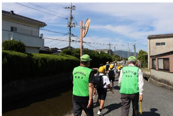
「みまもり隊」の活動