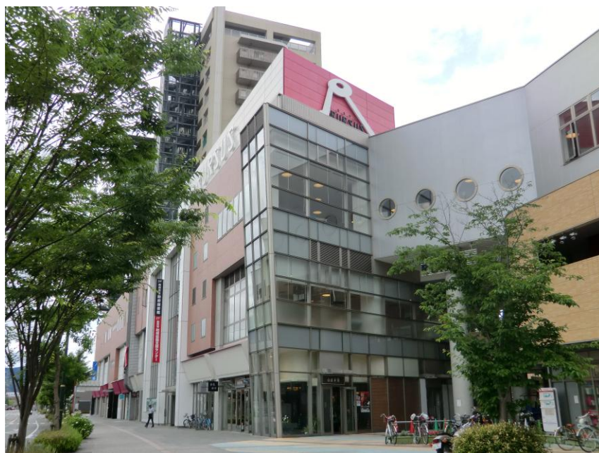
三哲文庫防府市立防府図書館（ルルサス防府3階）