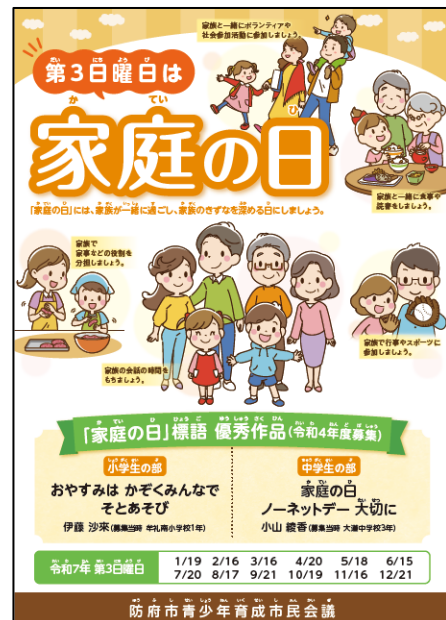
「家庭の日」運動の啓発チラシ