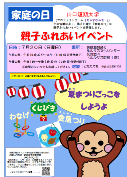
「家庭の日」親子ふれあいイベントのポスター