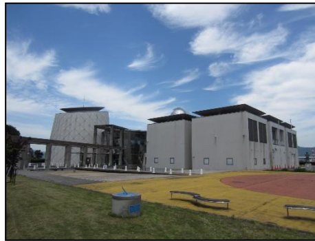
青少年科学館（ソラール）