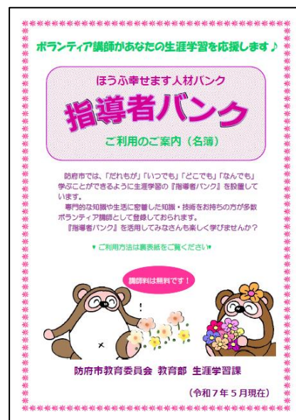
『ほうふ幸せます人材バンク「指導者バンク」』のメニュー表（表紙）