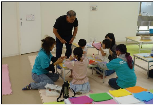
「家庭の日」親子ふれあいイベント