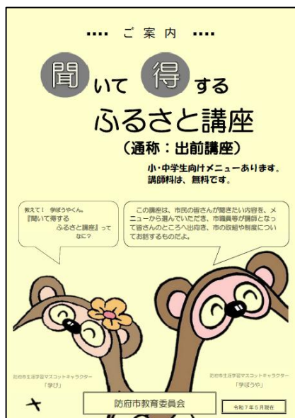
「聞いて得するふるさと講座」のメニュー表（表紙）