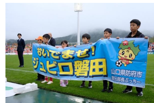
防府市ホームタウンデー 横断幕披露