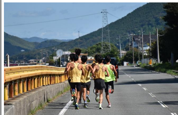
合宿の様子(向島ロード)