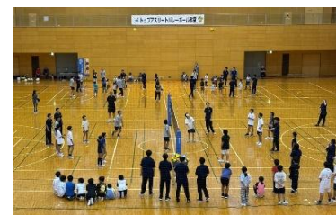
トップアスリート教室(バレーボール)