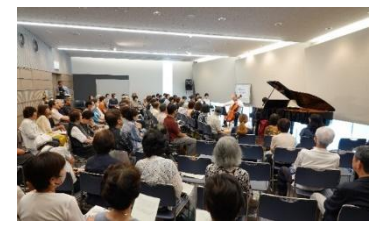
音楽普及セミナー