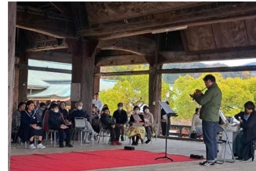
スプリングセミナー(アウトリーチ)