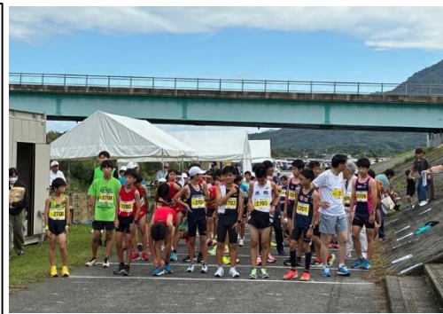
佐波川ロードレース スタート前