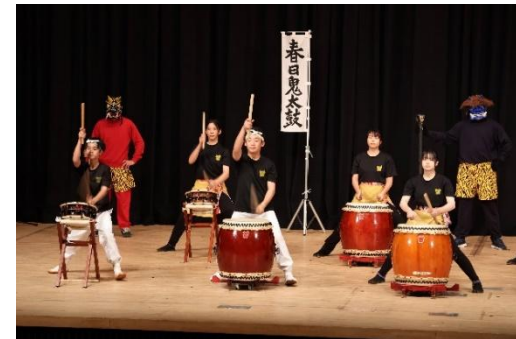
こども文化祭(春日鬼太鼓)