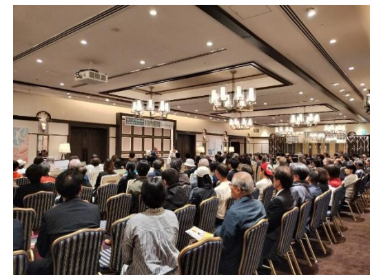
トップアスリート講演会