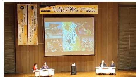
歴史観光講演会の開催