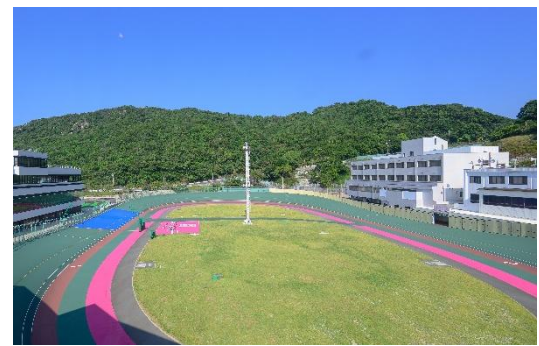
選手宿舎等のトイレ洋式化などの施設改修