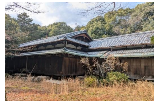
榎邸主屋・付属屋