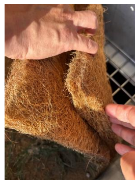
高密度フィルター