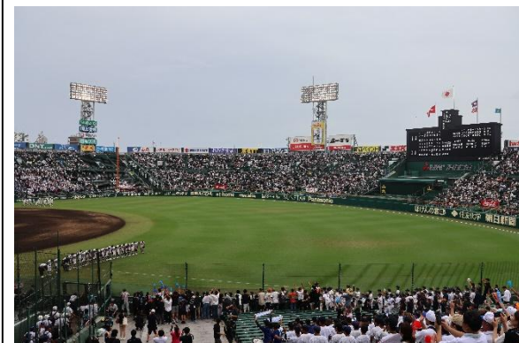
夏の甲子園大会出場