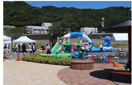
交流イベントの実施