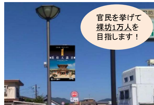
防府天満宮表参道へのタペストリー設置イメージ