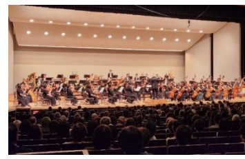
オーケストラ公演