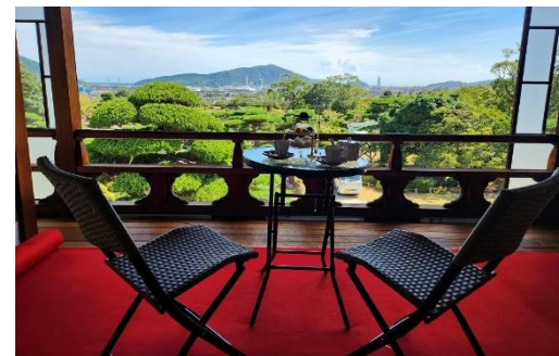
体験型観光商品 (旧毛利家本邸でのアフタヌーンティ体験)