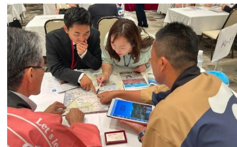
海外旅行会社への売り込み(商談会)