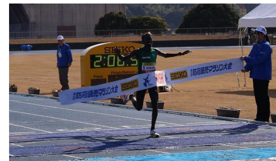
大会新記録(2:06:58)で優勝した ワークナー・デレセ選手