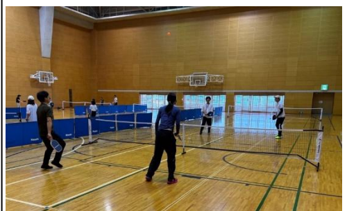
ニュースポーツ体験会 (ピククルボール)