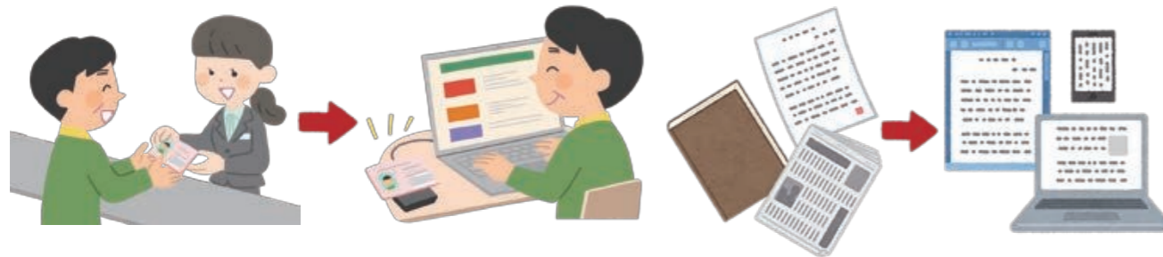
マイナンバー制度を活用した行政手続のオンライン化

Artificial intelligence の略。人工知能のことを指し、人間がコンピューターに対してあらかじめ分析上注目すべき要素を全て与えていなくても、コンピューター自らが学習し、一定の判断を行うことが可能になる(議事録自動作成など)。