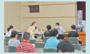
新型コロナワクチンの集団接種 (令和3年4月)