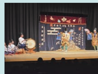
こども文化祭(安芸高田市子ども神楽団)