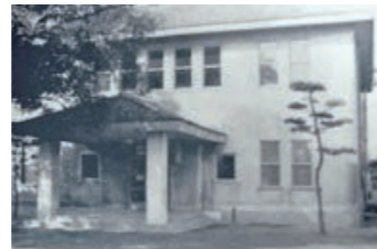
三哲文庫(現図書館)開設 (昭和16年4月)