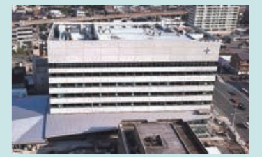
市役所新庁舎オープン (令和7年1月)