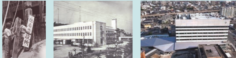
昭和11年8月 市制施行