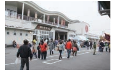
潮彩市場防府が「道の駅」として開業 (平成27年10月)