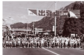
第1回防府読売マラソン大会開催 (昭和45年12月)