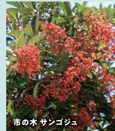
市の木 サンゴジュ