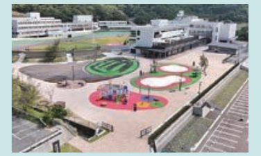
競輪場リニュアル(KEIRINパーク併設) (令和6年10月)