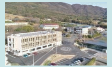
農林業知と技の拠点オープン (令和5年4月)