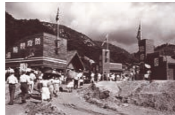
競輪場開設 (昭和24年9月)