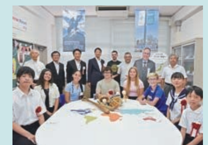
青少年語学研修相互派遣(モンロー市)