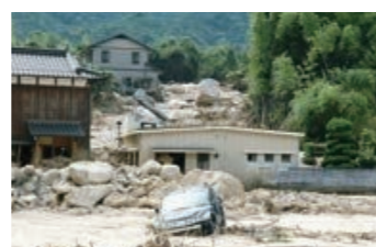
中国・九州北部豪雨により 市内で甚大な被害が発生 (平成21年7月)

1936年8月25日に防府町、中関町、華城村、牟礼村が合併し防府市が誕生しました。 以来90年、防府市は着実にあゆみを進めてきました。 先達から受け継いだ「すばらしい防府」を誇りとし、守り、育て、 「明るく豊かで健やかな防府」の実現を目指し、来るべき100周年に向けて進んでいきます。