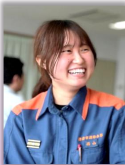
令和4年採用 年採用

私は高校生の頃、女性消防士として働いている部活の先輩の姿を見て『この人と一緒に仕事がしたい』と思い、消防士を目指しました。