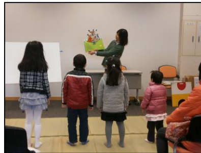
生涯学習フェスティバルでの「おはなしでんしゃ」さん

防府市立防府図書館 〒747-0035 防府市栄町一丁目5番1号 ルルサス防府3階 TEL:22-0780 FAX:22-9916 E-mail:info@library.hofu.yamaguchi.jp