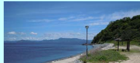
海水浴場・キャンプ場