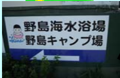
看板の⇒の方向に進む