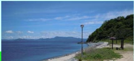
海水浴場・キャンプ場

津久美浜は、夏のシーズン中、 海水浴やキャンプでにぎわいます。 キャンプ場は無料で利用できます ので、夏のレジャーにお勧めです。