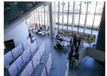
▲アスピラート会場でのイラスト展示