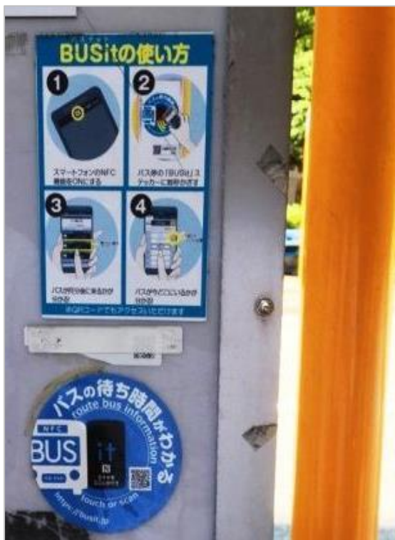
バス停に貼り付けられたQRコード