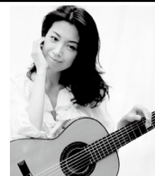
村治佳織

と き 3月16日(土) 開演 午後2時 と ころ アスピラート3階 音楽ホール 入 場 料 全席指定 4,000円 高校生以下 2,000円 ※財団会員500円引、当日500円高 ※未就学児はご遠慮ください。