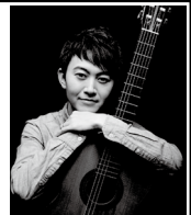
村治奏一