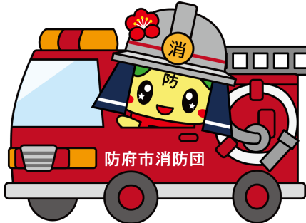
防府観光マスコットキャラクター 「ぶっちー」 ©防府市